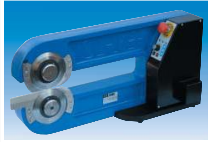
SEP1M code 100.0001 = 110 v SEP1M code 100.0002 = 220 v