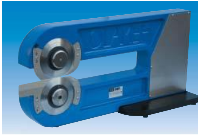
SEP1 code 100.0000

macchina manuale o motorizzata per separazione schede